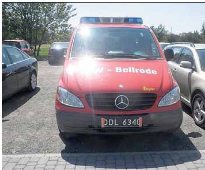
Kleiner Spaß mit unserem MTW der Feuerwehr Beilrode

Im Rahmen unserer Partnerschaft zwischen den Gemeinden Kolonowskie/Polen und der Gemeinde Beilrode fuhr eine kleine Delegation vom 18. bis 20.05.2012 nach Kolonowskie.