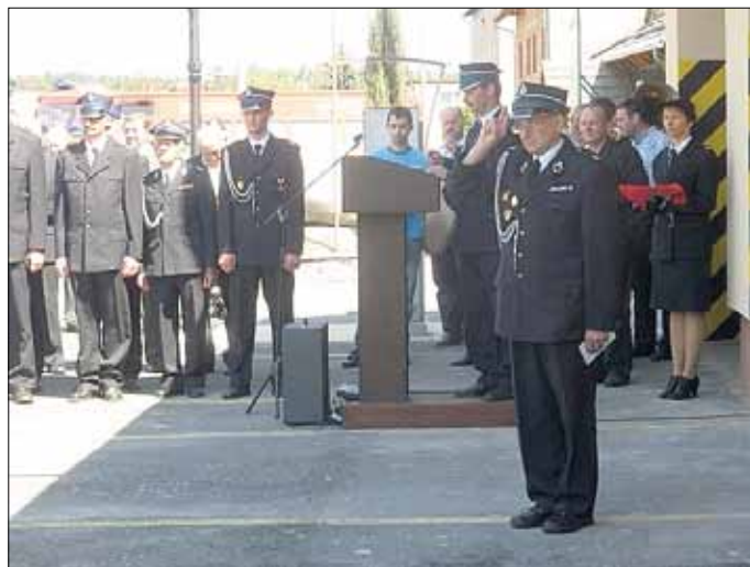
Feierlicher Gruß an die Gäste

Am 19.05.2012 weilten wir zu den feierlichen Veranstaltungen, die mit einem Festgottesdienst und der darauf folgenden Weihe des neuen Feuerwehrautos begannen. Anschließend konnten alle Gäste ein Grußwort an die Feuerwehr Kolonowskie richten.