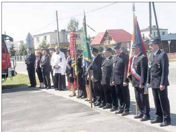
Die Gäste zur Weihe des Feuerwehrfahrzeuges